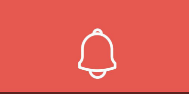
Register for alerts